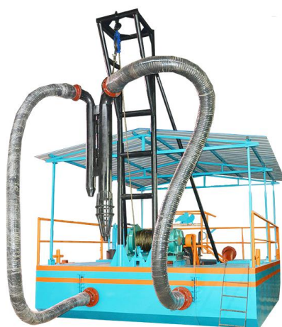
Добычное оборудование для сапротеля

Потребляемая суммарная мощность – 146 кВт, обслуживающий персонал – 10 чел. Вес оборудования – 10,3 т. Комплект перевозится на 3 автомашинах типа КАМАЗ. Оборудование занимает площадь цеха 17х15 м с высотой потолка до 6 м.